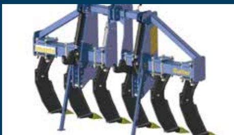
コンビネーション用のイマンツ社サブソイラー

イマンツ社のスペーダーマシンはユーザーに合わせた 最適な作業の提案を約束します。